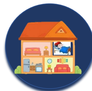
Μείνετε μακριά από άλλους