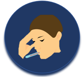
Ελέγχετε τα συμπτώματα