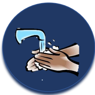
Πλένετε τα χέρια