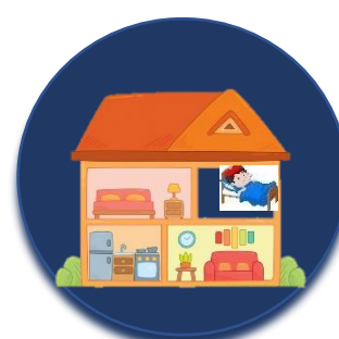
Sepárese de los demás