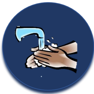
Lávese las manos frecuente