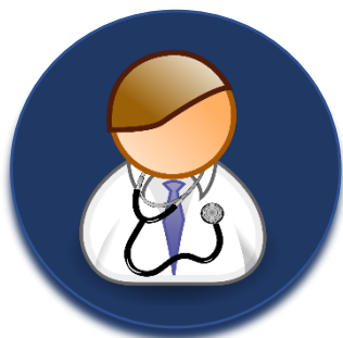
Llame al médico