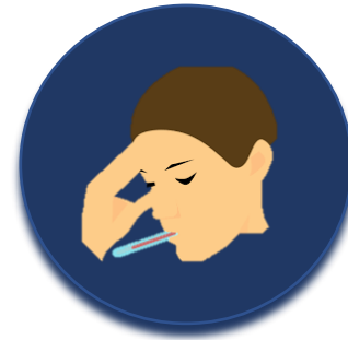
Monitoree sus síntomas