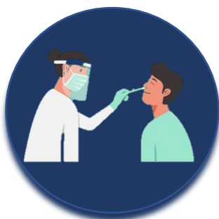
Hágase la prueba