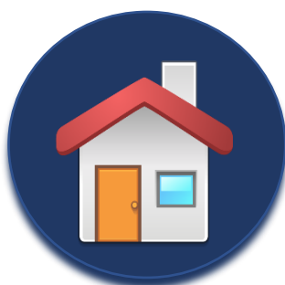
Quedase en casa